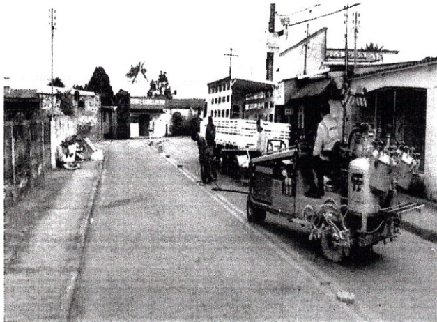
FOTO 01- Instalação de sinalização com tachões, para divisão de pista.