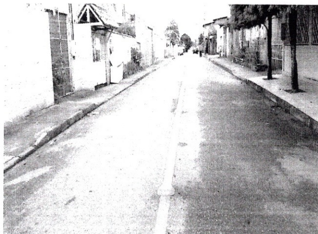
FOTO 06 – Revitalização da sinalização do eixo simples amarelo com tachões.