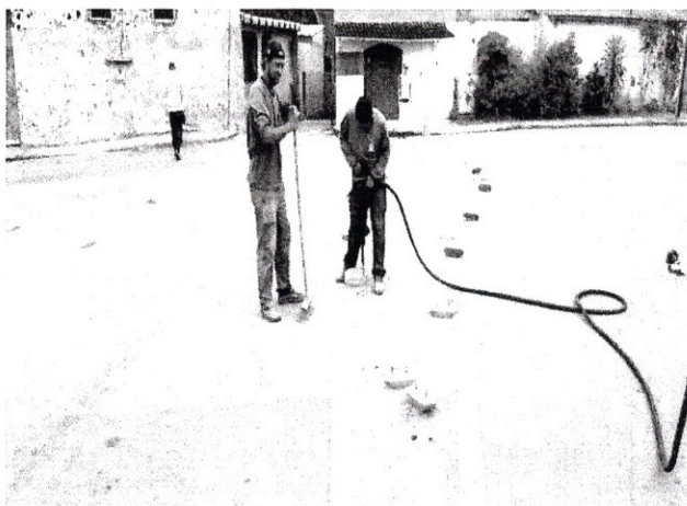
FOTO 03 – Instalação de sinalizações com tachões, para divisão de sentidos opostos.