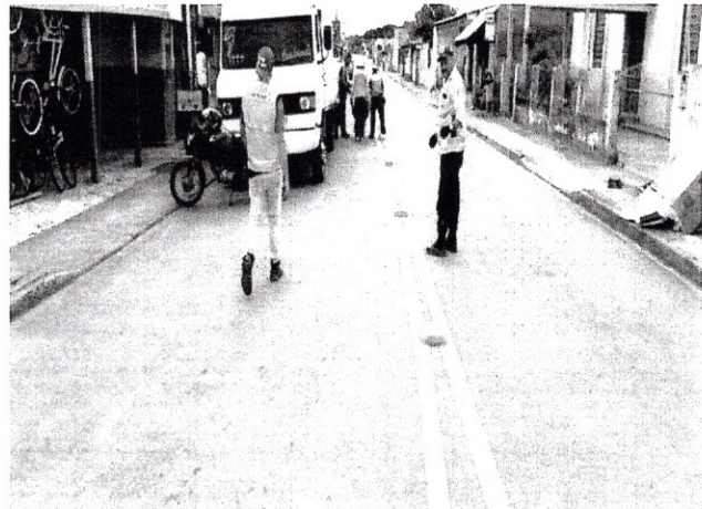
FOTO 02 - Instalação de sinalização com tachões, para divisão de pista.