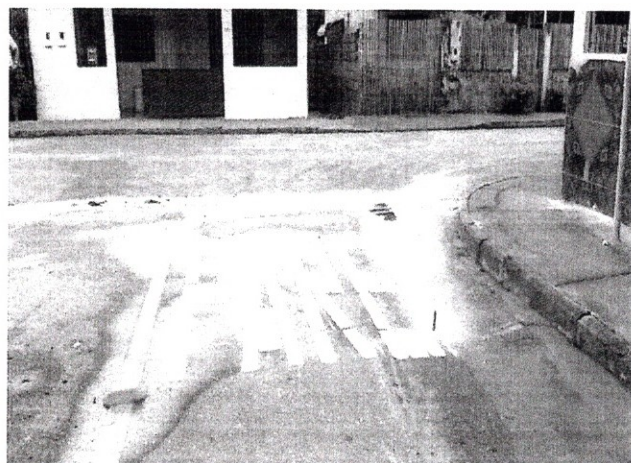
FOTO 05- Revitalização da sinalização, retenção com nome PARE.