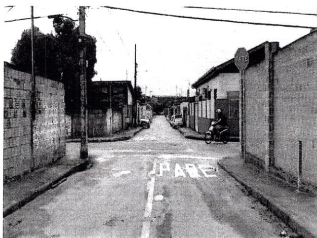
FOTO 08 – Revitalização da sinalização, retenção com nome PARE e Placa de Parada Obrigatória.