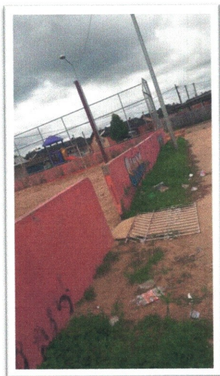
Figura 1- Revitalização da Praça Pública.