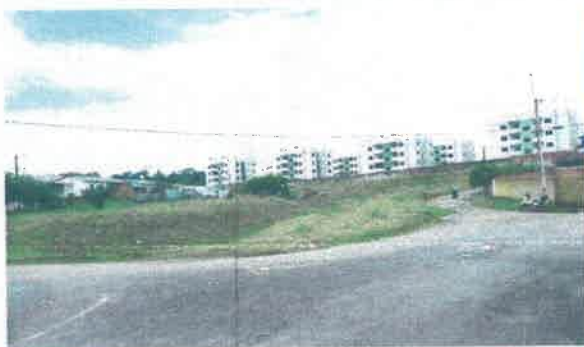
Áreas verdes roçadas / Residencial Juarez Távora.