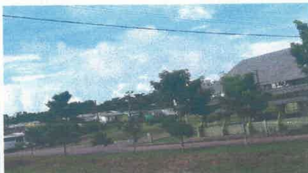
Serviço de retirada mecanizada / Residencial Juarez Távora.