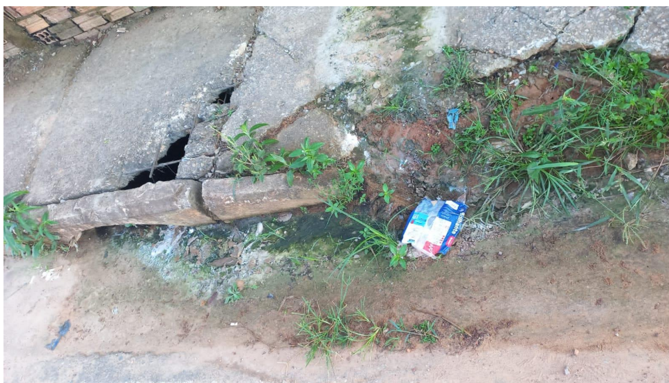
Figura 1 – Necessidade de manutenção na Rede de esgoto.