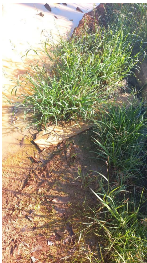
Figura 1 – Necessidade de manutenção na Rede de esgoto.