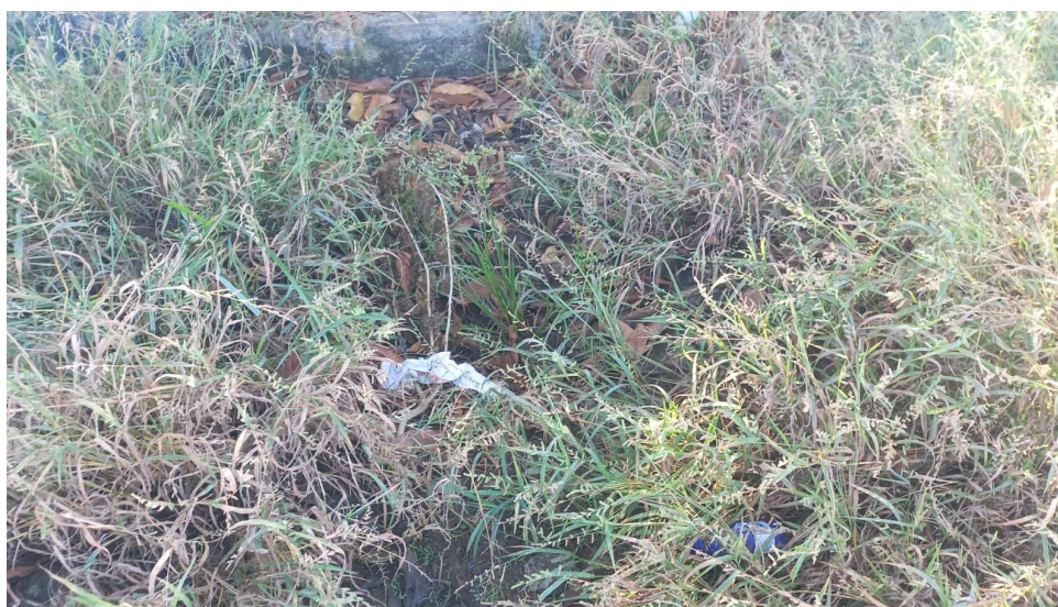
Figura 1 – Necessidade de manutenção na Rede de esgoto.