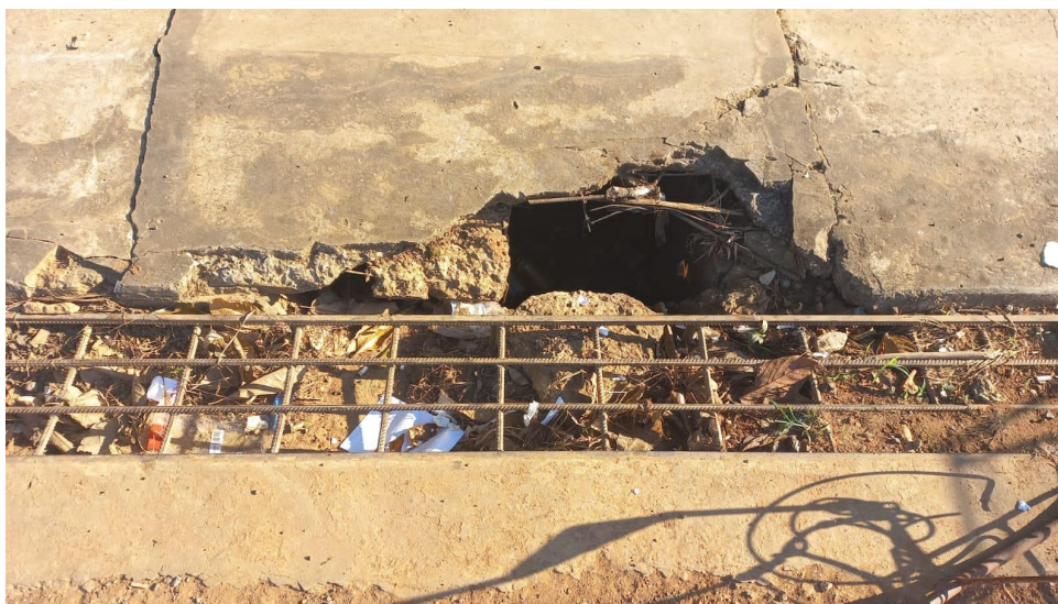
Figura 1 – Necessidade de manutenção na Rede de esgoto.