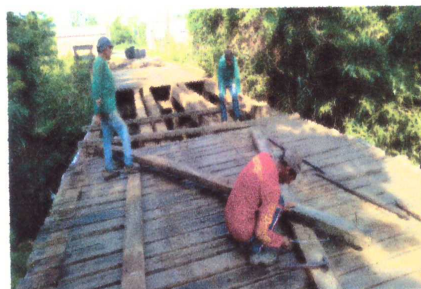
FOTO 10 - TROCA DO ASSOALHO