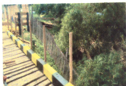
FOTO 15 - INSTALAÇÃO E PINTURA DE GUARDA CORPO