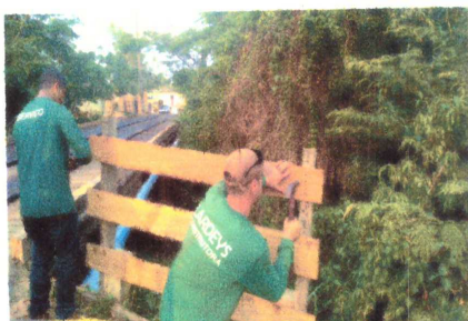
FOTO 19 - INSTALAÇÃO DE SINALIZAÇÃO