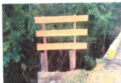
FOTO 20 - INSTALAÇÃO DE SINALIZAÇÃO