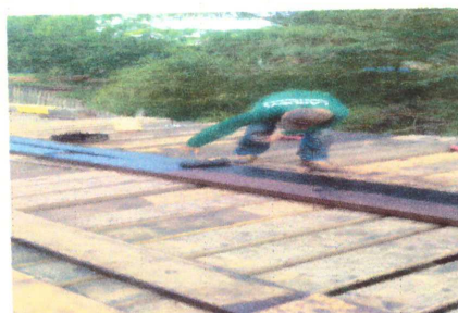
FOTO 14 - FIXAÇÃO E IMPERMEABILIZAÇÃO DE RODA GUIA COM EMULSÃO ASFÁLTICA