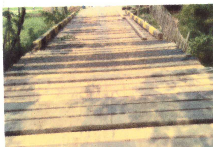
FOTO 12 - ASSOALHO FINALIZADO E FIXAÇÃO DOS GUARDA RODAS