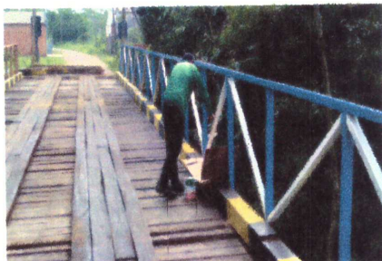
FOTO 17 - INSTALAÇÃO E PINTURA DE GUARDA CORPO