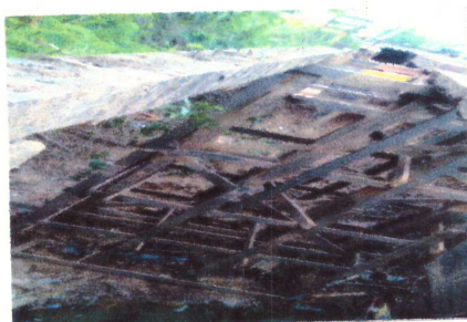
FOTO 05 - MONTAGEM E FIXAÇÃO DE ANDAÍME PARA MANUTENÇÃO DA ESTRUTURA