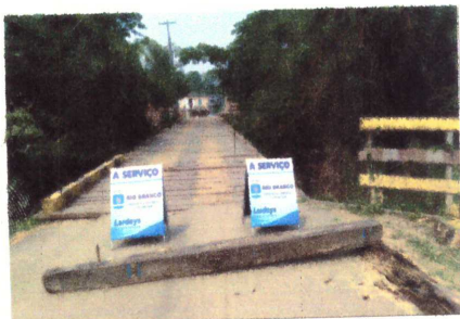
FOTO 01 - POSICIONAMENTO DOS CAVALETES DE SINALIZAÇÃO