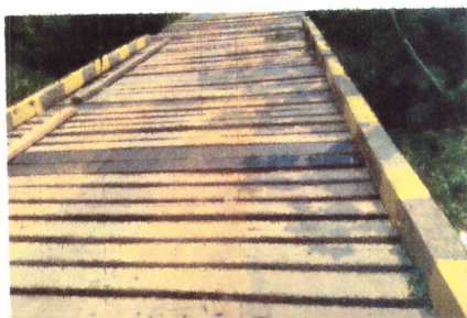
FOTO 11 - ASSOALHO FINALIZADO E FIXAÇÃO DOS GUARDA RODAS