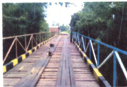
FOTO 18 - INSTALAÇÃO E PINTURA DE GUARDA CORPO