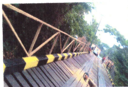
FOTO 16 - INSTALAÇÃO E PINTURA DE GUARDA CORPO