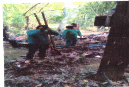
FOTO 04 - MONTAGEM E FIXAÇÃO DE ANDAÍME PARA MANUTENÇÃO DA ESTRUTURA