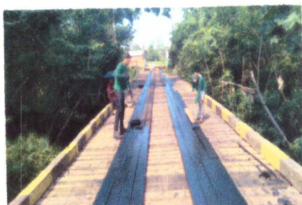
FOTO 13 - FIXAÇÃO E IMPERMEABILIZAÇÃO DE RODA GUIA COM EMULSÃO ASFÁLTICA