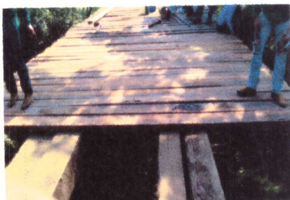
FOTO 09 - TROCA DO ASSOALHO