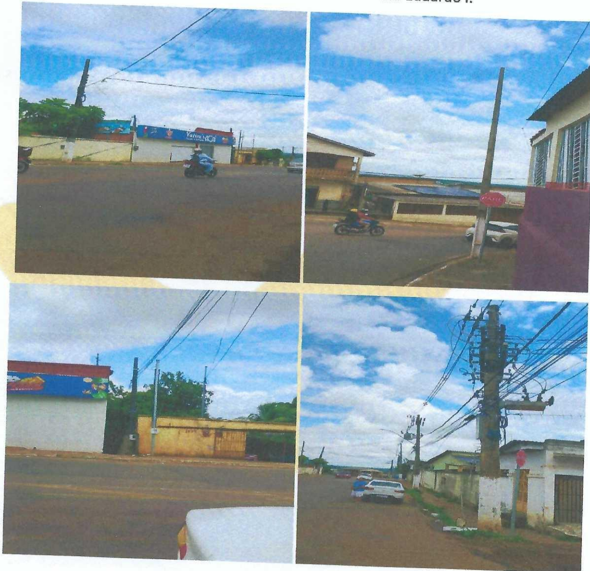
Figuras 1, 2, 3 e 4 – Rua A - Bairro João Eduardo I.

Rio Branco - Acre, 09 de dezembro de 2025.