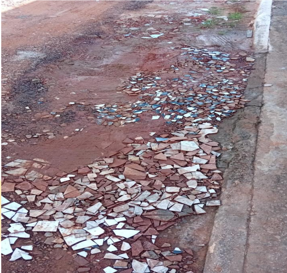
Figura 1 – Rua Alameda Anapolis - Bairro Jardim Europa.

Rio Branco - Acre, 22 de outubro de 2025.