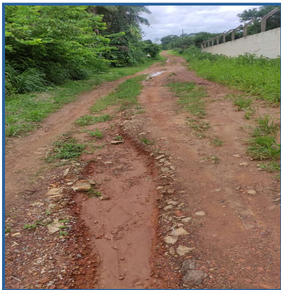
Figura 1 - Pavimentação