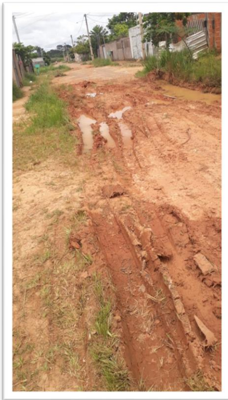
Figura 1- Pavimentação de Via Pública.