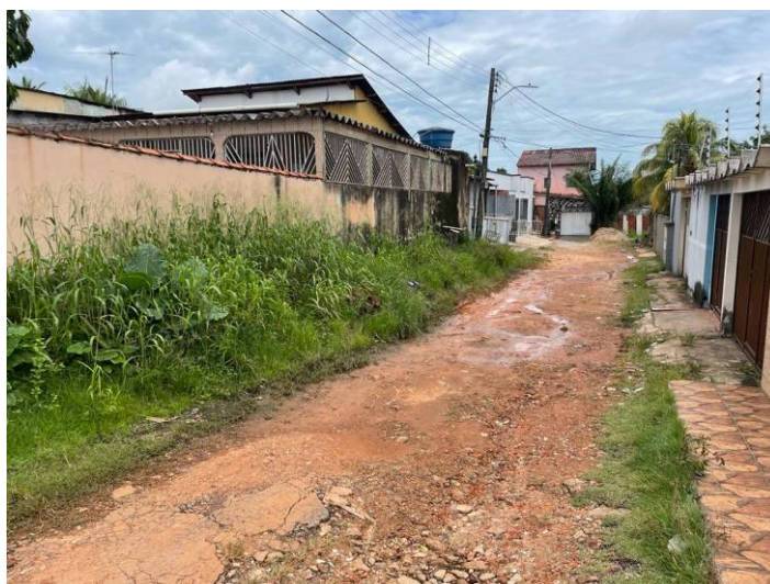
Figura 2 – Entrada da rua

Figura 1 – Aspecto geral da rua. Percebe-se que não foi feita nenhuma melhoria. Percebe-se ainda a falta de calçada e bueiros.