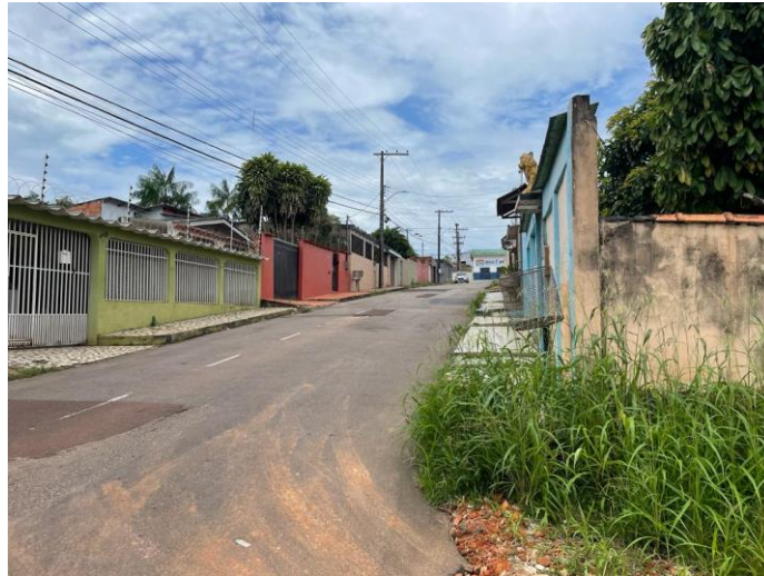
Figura 3 – Rua fica paralela a uma das ruas de maior circulação no Conjunto Manoel Julião