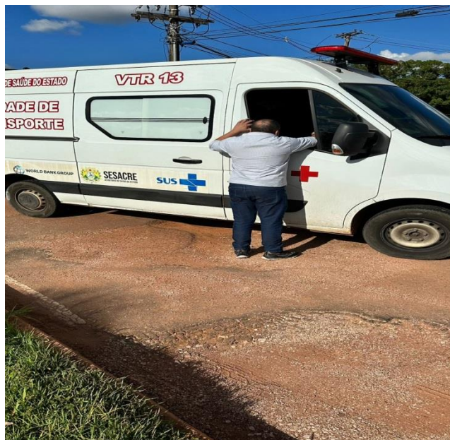
Figura 3– Dificuldade de passagem até mesmo das ambulâncias.