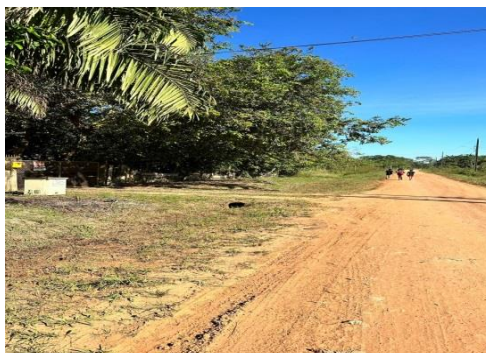
Figura 3– Estrada com atoleiro.