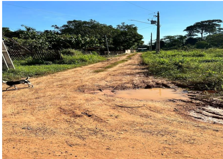
Figura 4– Pavimentação, saneamento básico, instalação de bueiros e calçamento.