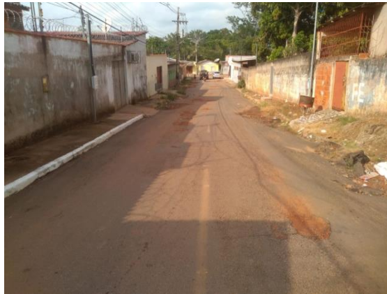
Figura 4 – Rua totalmente esburacada e sem nenhuma passagem segura para os pedestres.