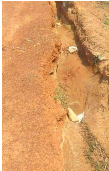
Figura 4– Criação de sistema de saneamento básico.