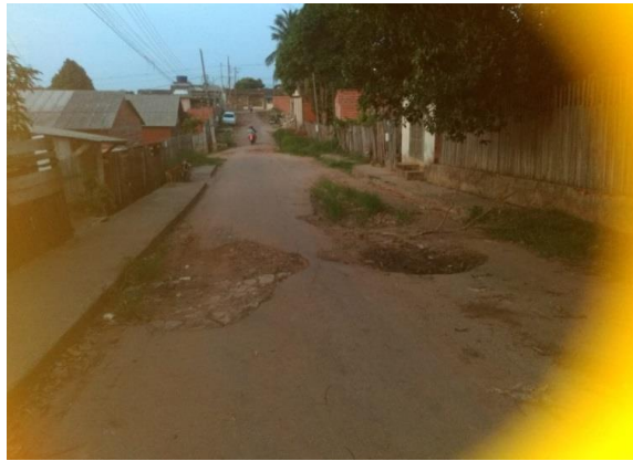
Figura 4– Dificuldade de transição de carros como de pessoas.