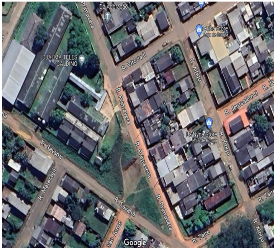
Figura 2 - Aspecto geral da Rua Primavera, bairro Jorge Lavocat.