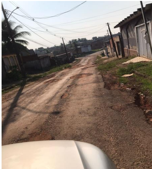
Figura 4– Criação de sistema de saneamento básico.