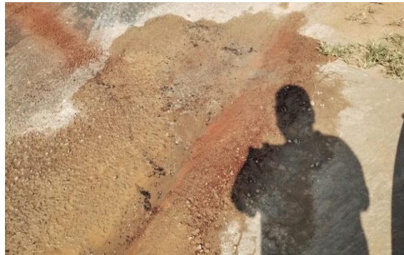
Figura 3– A avenida necessita de pavimentação, calçamento e saneamento básico.