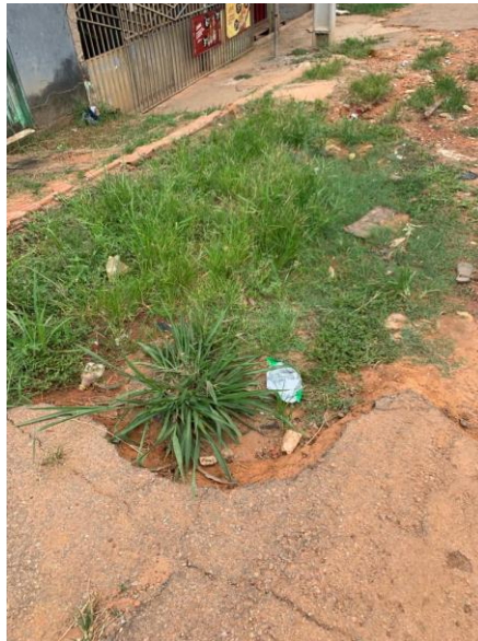
Figura 3– Pavimentação, calçamento, saneamento básico, instalação de bueiros.