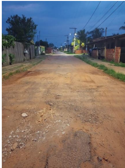
Figura 3— A rua necessita de pavimentação asfáltica e calçamento.