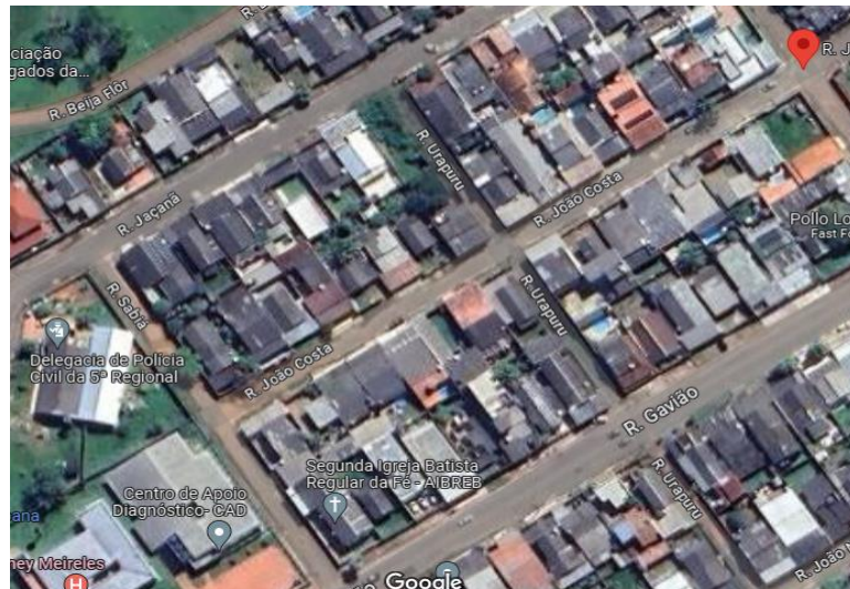
Figura 2 – Aspecto geral da Rua João Costa no Conjunto Adalberto Sena.